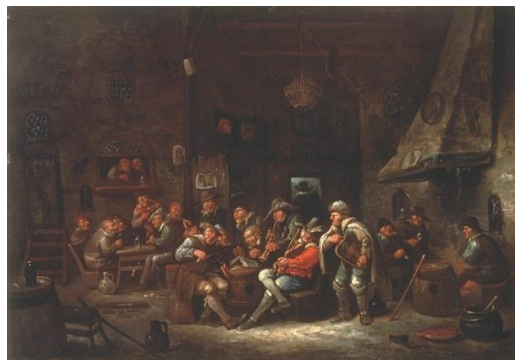
Egbert van Heemskerck, Paysans chantant et jouant de la musique XVII ème siècle Bailleul, Musée Benoît-De-Puydt.