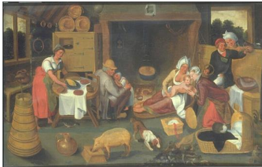
Marten van Cleve, Intérieur rustique XVI ème siècle Valenciennes, Musée des Beaux-Arts.