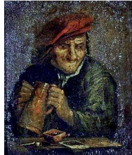
Adriaen Brouwer, Buveur de bière XVII ème siècle Cambrai, Musée des Beaux-Arts.