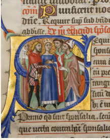
Pontifical de Pierre de la Jugie, 14 e siècle