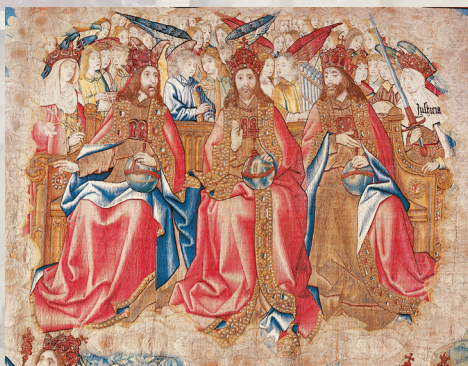
Tapisserie de «la Création du Monde», fin du 15 e siècle

Billet Pass : 9 € et 6 € en tarif réduit