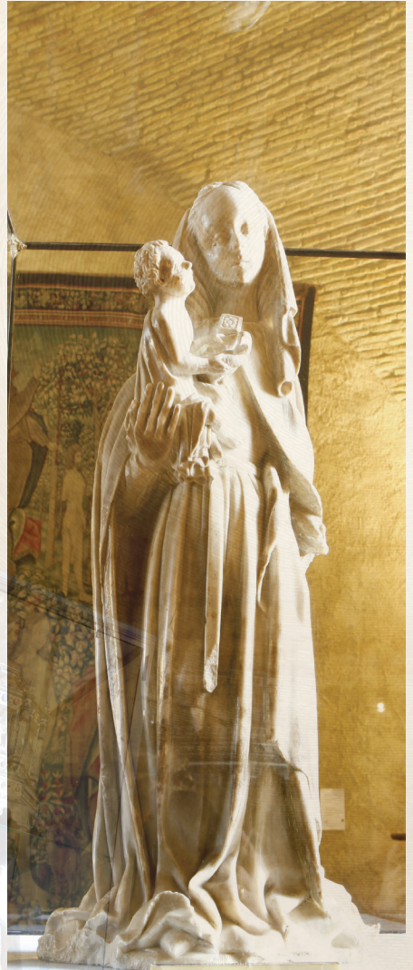
Vierge à l'enfant, 15 e siècle

La coupole confère à cet espace une particularité sonore remarquable : en vous plaçant dans un angle face au mur, vous pourrez communiquer à voix basse avec votre interlocuteur placé dans l'angle opposé, sans être entendu du reste de la pièce.