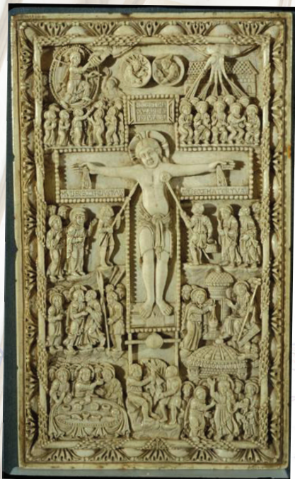
Crucifixion, 9 e siècle

La visite du Trésor complète celle du chœur de la cathédrale également orné d'œuvres de premier plan : les somptueux tombeaux des archevêques, le retable gothique sculpté en pierre polychrome au sein de la chapelle Notre-Dame de Bethléem, la tapisserie du Baptême de Clovis (17 e siècle) dans la chapelle du Sacré-cœur, ou bien le tableau de La chute des anges rebelles de Rivalz (fin 17 e siècle) au-dessus de l'autel de la chapelle Saint-Michel.