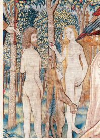
Tapisserie de «la Création du Monde», fin 15 e siècle