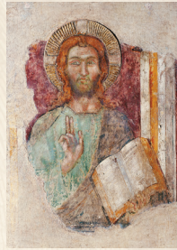
Christ bénissant, fresque, 14 e siècle