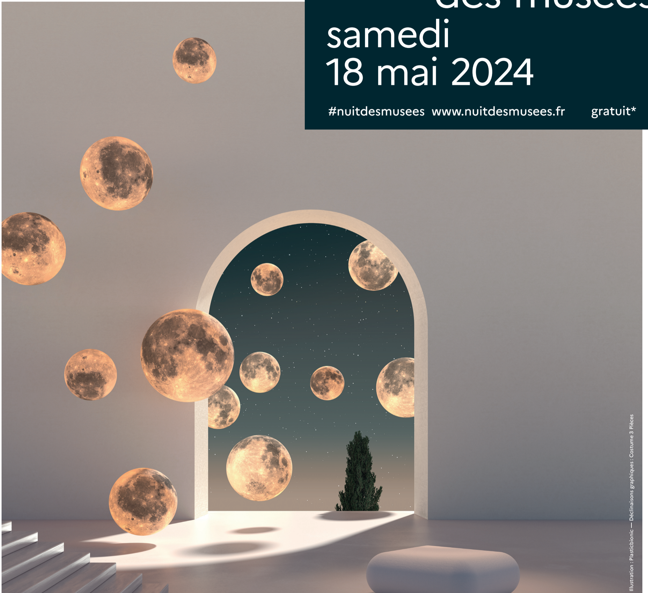
Illustration : Plasticbionic — Déclinaisons graphiques : Costume 3 Pièces

#nuitdesmusees www.nuitdesmusees.fr gratuit*