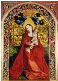
Martin Schongauer, La Vierge au buisson de roses , 1473, huile sur bois, Colmar, Église des Dominicains, propriété de la Collégiale Saint-Martin de Colmar

Parallèlement à cette production abondante, ses peintures, réalisées sur panneaux de bois comme il est d'usage à cette époque, ne sont que sept au total : le Retable d'Orlier et le Retable des Dominicains , conservés au Musée Unterlinden ; la Vierge au buisson de roses , visible dans l'église voisine des Dominicains ; l'Adoration des bergers , deux représentations de la Sainte Famille , ainsi que la Vierge à l'Enfant , sont eux conservés dans des collections publiques étrangères.