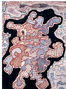
Jean Dubuffet, L'Hourloupe. Personnage en marche , 1962, gouache sur papier

En 1962, Jean Dubuffet réunit des dessins au stylo-bille, découpés et collés sur fond noir avec un texte en jargon dans une plaquette au titre énigmatique, l'Hourloupe , qu'il associe par assonance à « hurler », « hululer », « loup », « Riquet à la Houppe » ainsi qu'à la nouvelle de Maupassant sur l'égaré mental Le Horla .