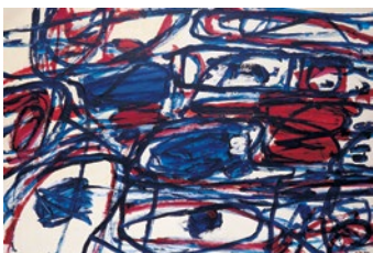
Jean Dubuffet, Mire G 142 (Kowloon) , 1983, peinture acrylique sur papier marouflé sur toile

À 73 ans, souffrant du dos, Dubuffet réalise des crayonnages dans une écriture encore plus enfantine et libérée ainsi que des citations simplifiées de ses périodes précédentes. De petits personnages drolatiques continuent de proliférer sur des surfaces en damier jusqu'aux dernières séries des Mires (1983) et Non-lieux (1984), griffonnages libres et