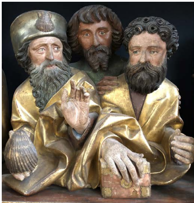
Nicolas de Haguenau, Retable d'Issenheim, Groupe d'apôtres avant restauration, 1512-1516, Musée Unterlinden, Colmar