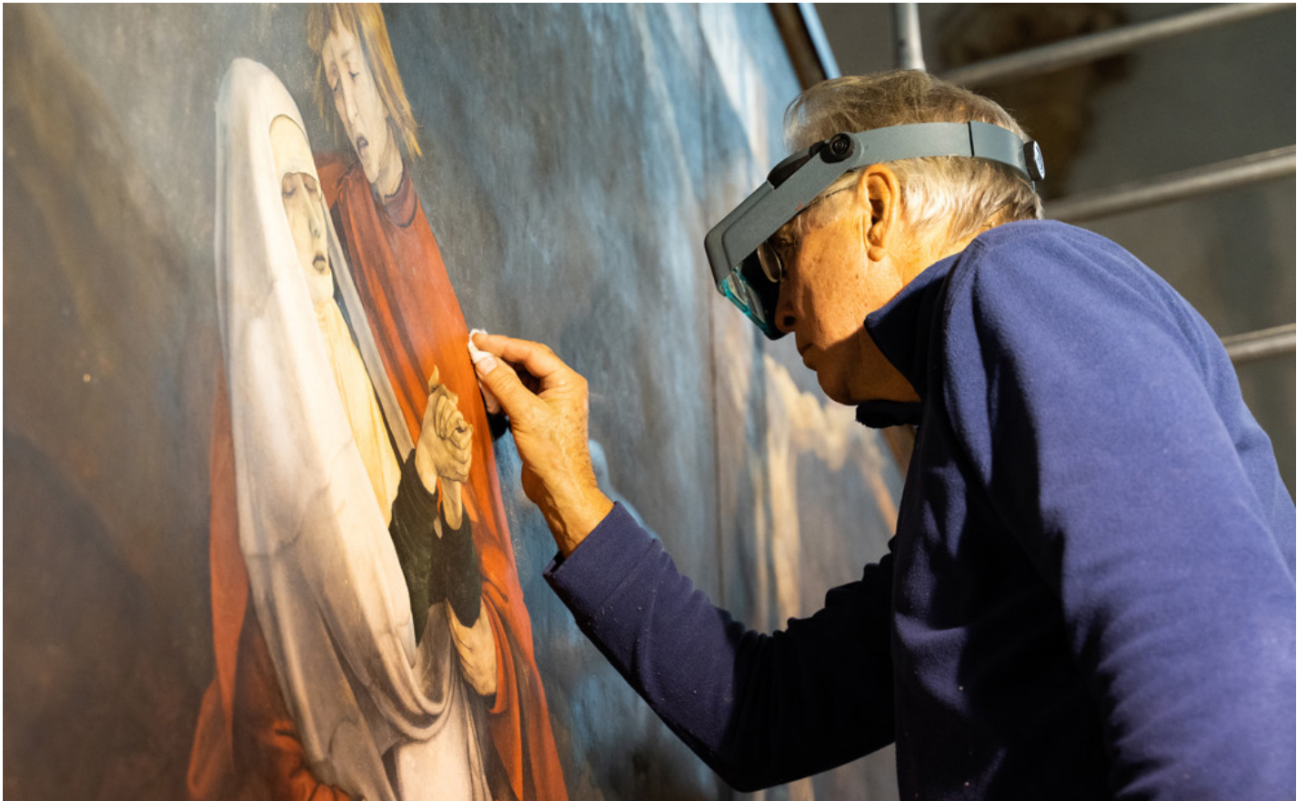
Retable d'Issenheim, Restauration de la Crucifixion par Anthony Pontabry, 2021, Musée Unterlinden, Colmar

Le Retable d'Issenheim... trois années, quasiment tous les jours, à côtoyer ce chef d'œuvre ! C'est un privilège unique, la chance d'une vie pour un passionné d'art et encore plus, pour un restaurateur. C'est la possibilité de l'admirer dans le silence de la chapelle quand le musée est fermé, de regarder de près sous tous ses angles, de redécouvrir les parties dissimulées sous les épais vernis au fur et à mesure de l'avancement du nettoyage, d'être au plus près de Grünewald et de son processus créatif.