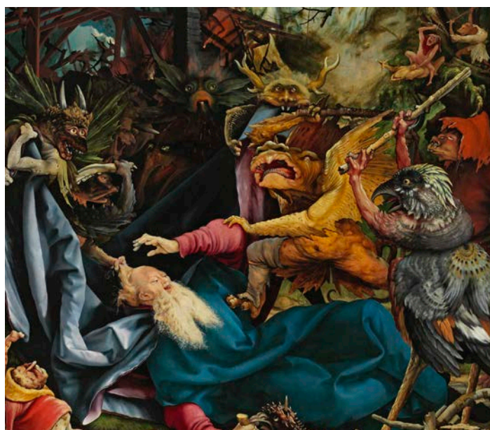
Grünewald, Retable d'Issenheim, Agression de saint Antoine par les démons, détail, 1512-1516, technique mixte (tempera et huile) sur panneaux de tilleul, Musée Unterlinden, Colmar

Régulièrement entretenu et revernì depuis le 18 e siècle, le Retable a fait l'objet de nombreuses études radiographiques et photographiques depuis les années 1950 jusqu'aux études scientifiques et analyses récentes menées par le Centre de Recherche et de Restauration des Musées de France (C2RMF).