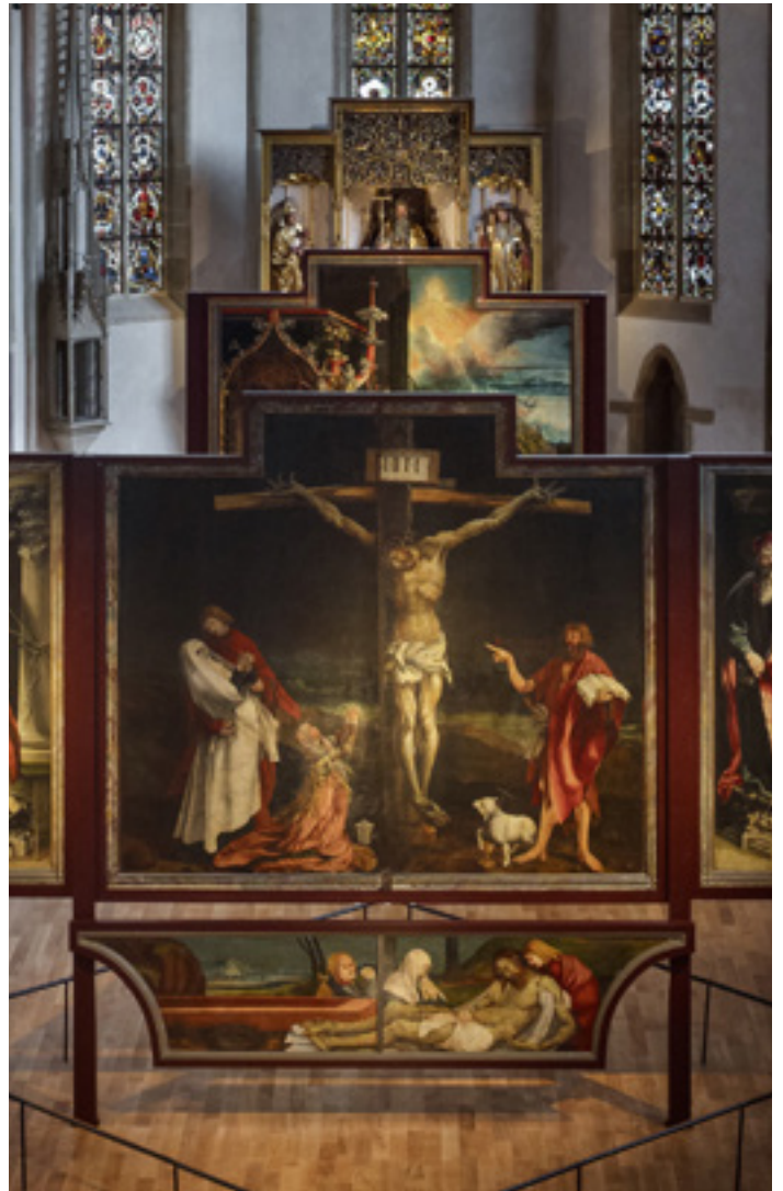
Grünewald et Nicolas de Haguenau, Vue du Retable d'Issenheim, 1512-1516, technique mixte (tempera et huile) sur panneaux de bois (tilleul), Musée Unterlinden, Colmar.

En 1852, il est transféré dans l'église de l'ancien couvent des Dominicaines d'Unterlinden, où il constitue le joyau du musée qui s'y organise alors et où il ne cesse de fasciner et d'envoûter ceux qui le contemplant.