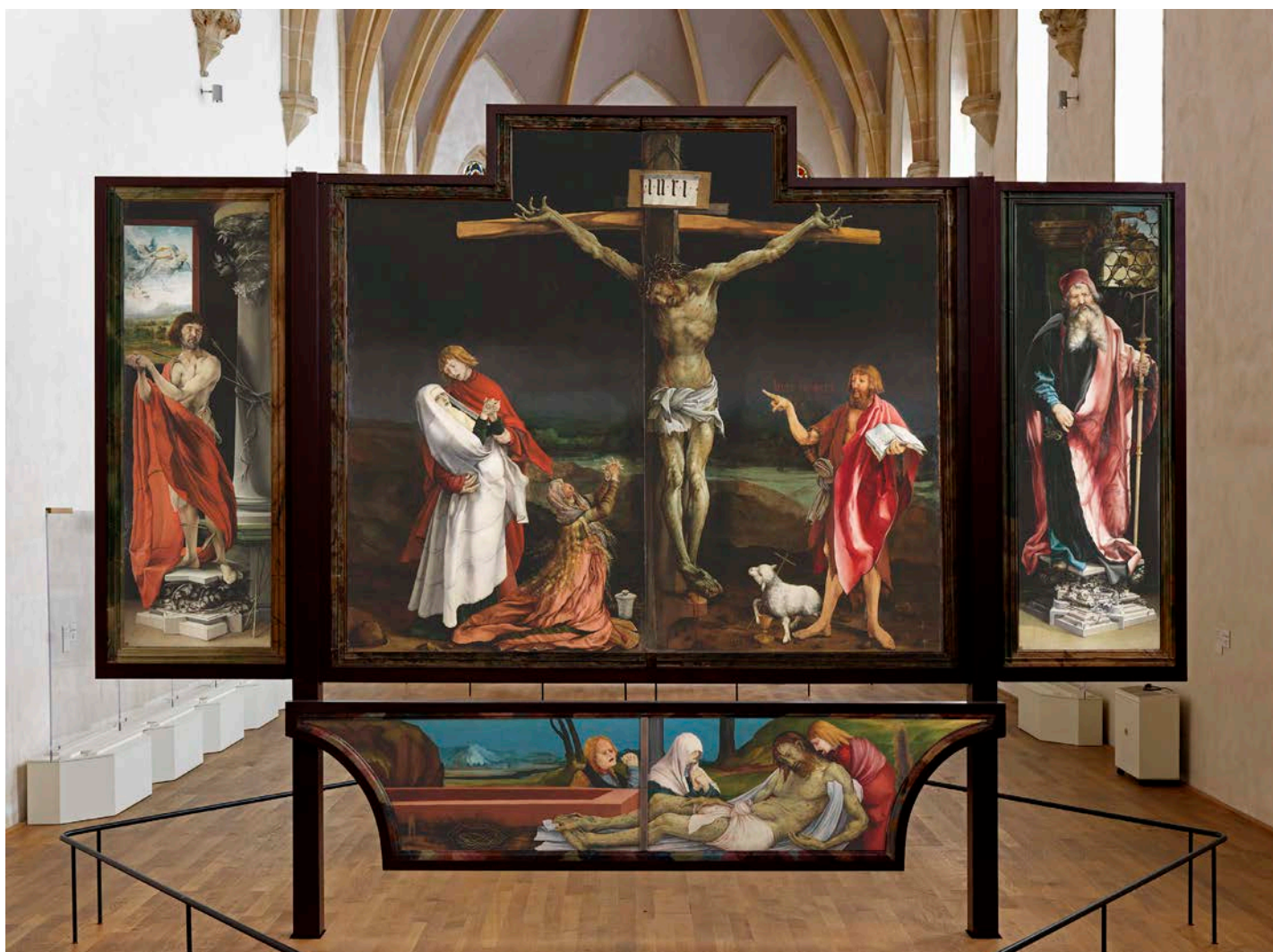
Grünewald, Retable d'Issenheim, Saint Sébastien, La Crucifixion, Saint Antoine, La Déploration, 1512-1516, technique mixte (tempera et huile) sur panneaux de bois (tilleul), Musée Unterlinden, Colmar.

Grünewald, Retable d'Issenheim, Saint Sébastien, La Crucifixion, Saint Antoine, La Déploration , 1512-1516