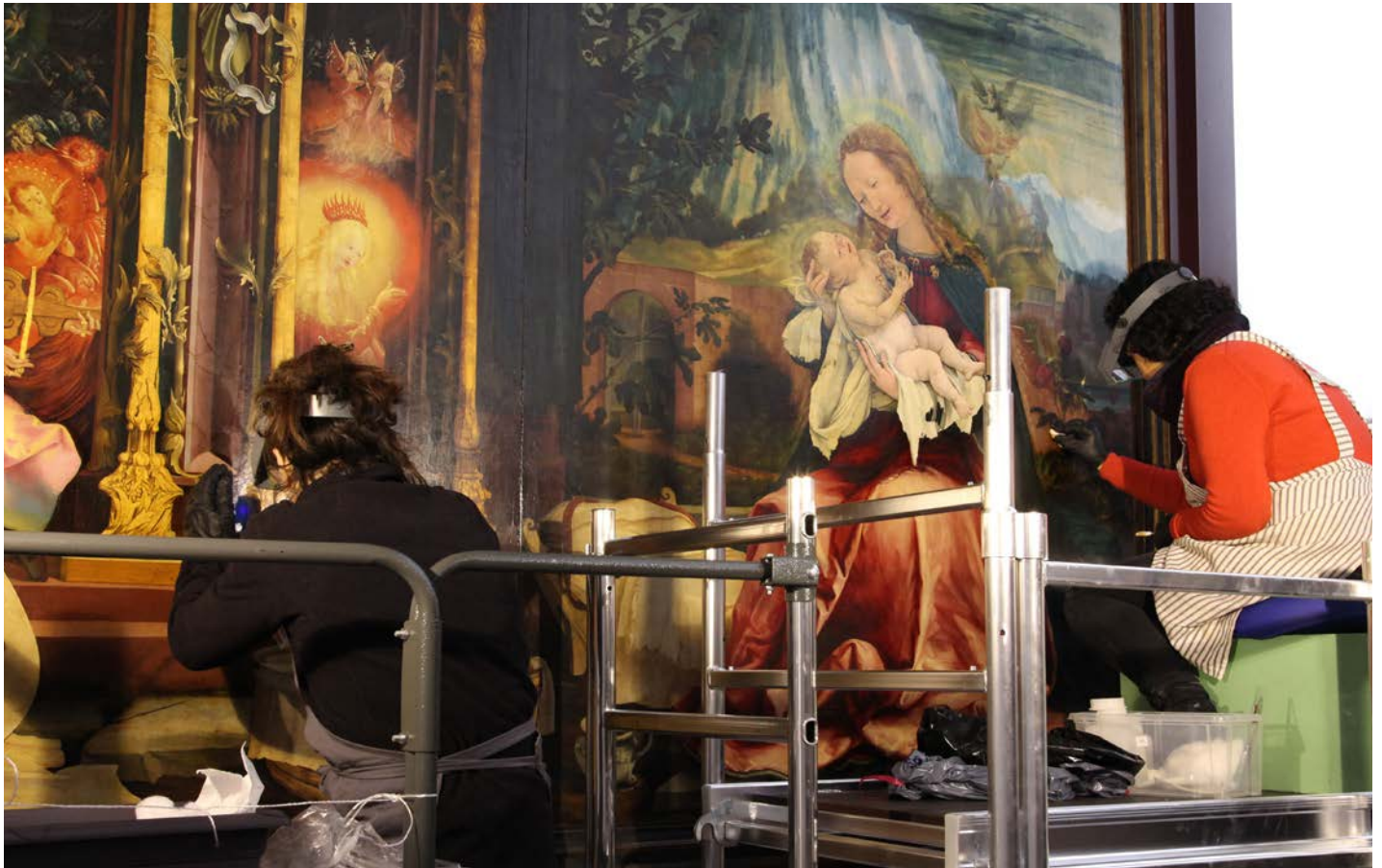
Grünewald, Retable d'Issenheim, Restauration en cours du Concert des Anges et de La Vierge à l'Enfant, 1512–1516, technique mixte (tempera et huile) sur panneaux de tilleul, Musée Unterlinden, Colmar

Lors de l'appel d'offre, le comité de suivi de la restauration avait estimé la durée du chantier à 4 années. Il fallait en effet prendre en compte de nombreux facteurs :