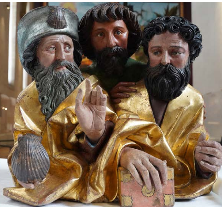
Nicolas de Haguenau, Retable d'Issenheim, Groupe d'apôtres après restauration, 1512-1516, Musée Unterlinden, Colmar

Travailler sur les sculptures du Retable d'Issenheim représentait un véritable défi, non seulement en raison du prestige immense dont jouit cette œuvre, mais aussi à cause de la complexité de l'étude de la polychromie, entreprise depuis plusieurs années déjà. Or le décodage des nombreuses couches colorées qui recouvrent le bois de tilleul a finalement permis de comprendre qu'elle datait pour sa majeure partie, du 16 e siècle, ce qui est exceptionnel, car les sculptures étaient traditionnellement repeintes au cours du temps.