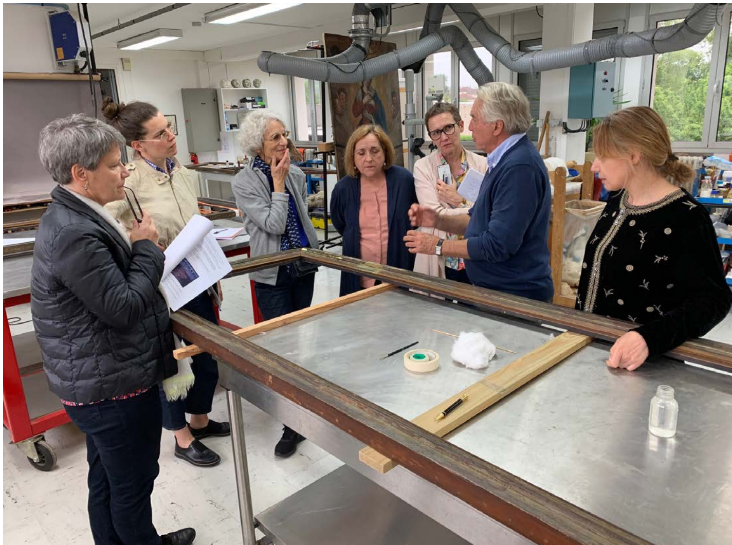
Membres du Comité scientifique, du C2RMF et restaurateurs, 2020, Vesoul

Icône de l'art occidental, le Retable d'Issenheim, réalisé entre 1512 et 1516, est l'un des chefs-d'œuvre du gothique tardif, dû à deux grands maîtres allemands : Grünewald (ou Mathis Gothart Nithart né à Wurtzbourg vers 1475–1480 et mort à Halle en 1528) pour la peinture et Nicolas de Hagenau (actif à Strasbourg entre 1485 et 1522) pour la sculpture. Ce monumental polyptique, constitué à l'origine de plusieurs panneaux articulés autour d'une caisse centrale ornée de sculptures, a été créé pour le maître-autel de l'église de la commanderie des Antonins d'Issenheim, au sud de Colmar. Consacré à saint Antoine et voué à la piété des malades atteints du feu de saint Antoine -véritable fléau de l'époque-, ce fascinant chef-d'œuvre témoigne, par son intensité dramatique, du génie hors norme de ses auteurs. Démonté et transporté à Colmar en 1793, à la Révolution française, le Retable est transféré au Musée Unterlinden lors de son ouverture en 1853, contribuant jusqu'à nos jours à la célébrité internationale du musée.