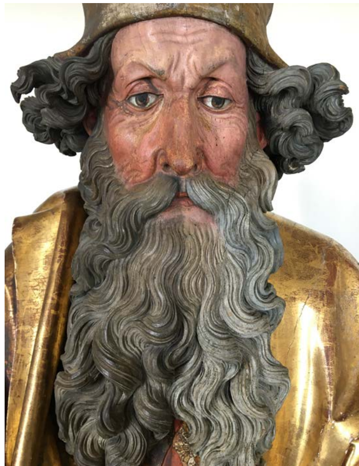
Nicolas de Haguenau, Retable d'Issenheim , Manche du vêtement de Saint Jérôme et Saint Antoine en cours de restauration au C2RMF à Paris, 1512-1516, sculptures (bois de tilleul), Musée Unterlinden, Colmar.

Les restauratrices des sculptures ont principalement travaillé au C2RMF (Centre de Recherche et de Restauration des Musées de France) à Paris.