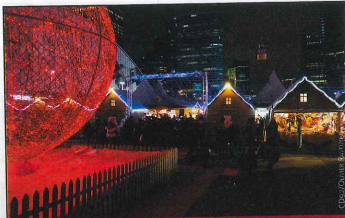
CD92/Quiver @ Boulogne