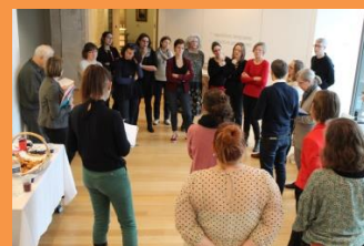
Le MUS a reçu la FEMS !