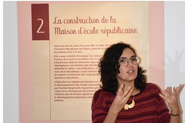
L'idéal de l'école républicaine de Jules Ferry ...