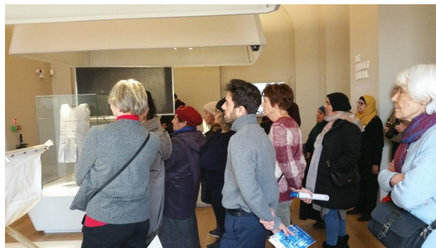
Le groupe à l'écoute des explications sur le projet social de l'école.