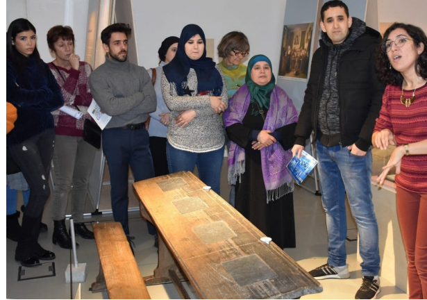
Banc d'école à 4 places avec les encrriers en porcelaine blanche et les ardoises intégrées dans le pupitre ...