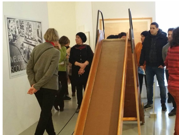
Une époque à laquelle installer un toboggan dans une école était précurseur ....