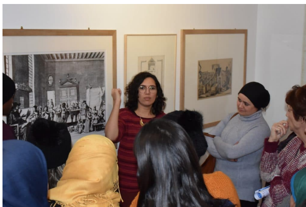
Début de la visite avec une illustration de l'enseignement individuel au 18ème siècle ... et le groupe SMR très attentif ...

Un grand merci au musée de Suresnes pour son accueil.