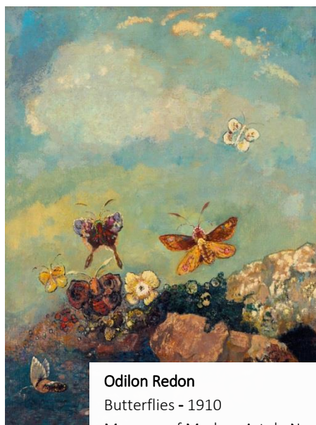
Odilon Redon Butterflies - 1910 Museum of Modern Art de New York

Pour en savoir plus : http://www.fontfroide.com