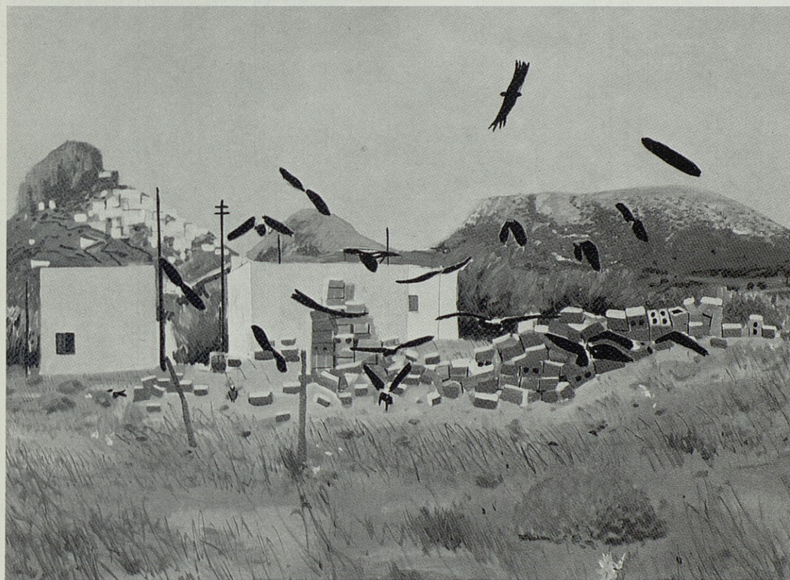
Gilles Aillaud : Les choucas 1978

L'exposition présentée est une rétrospective du travail qu'il mène depuis 30 ans.